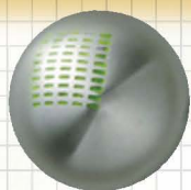
特殊塗料による色付け