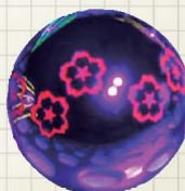
ブラックライト照射状態

従来の刻印球よりも深く刻印を打ち込み、耐久性蛍光塗料を使用。ブラックライトを当てると光ります。